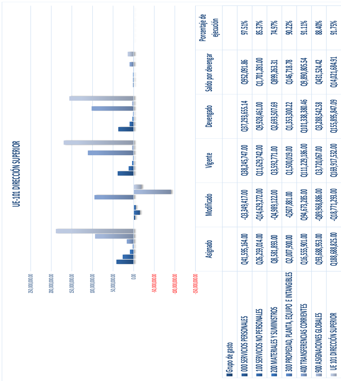
Gráfica No. 2 Ejecución Presupuestaria Al mes de diciembre de 2023