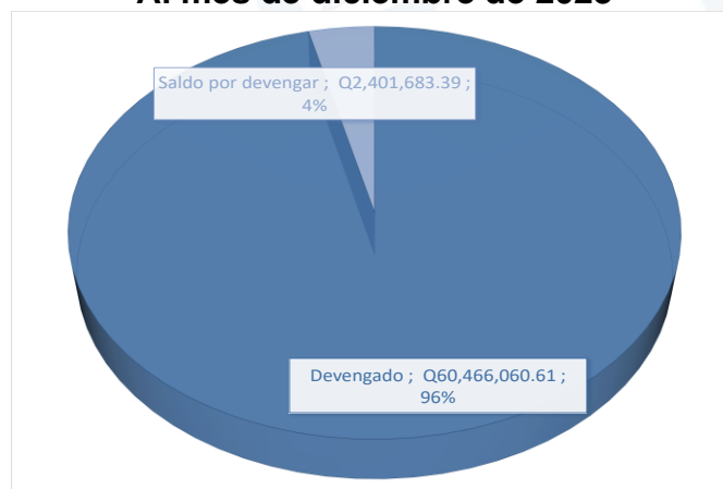
Gráfica No. 1 Ejecución presupuestaria Al mes de diciembre de 2023