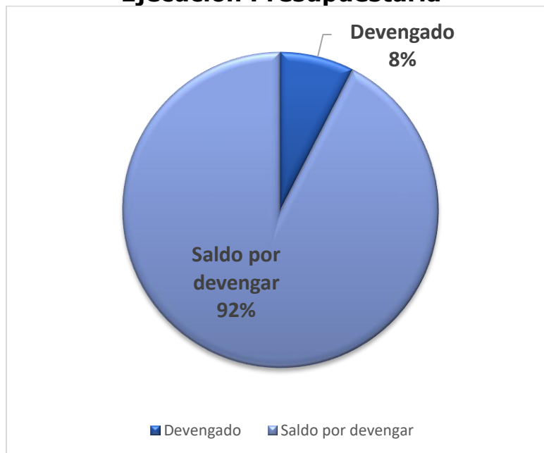
Gráfica No. 1 Viceministerio de Integración y Comercio Exterior Ejecución Presupuestaria