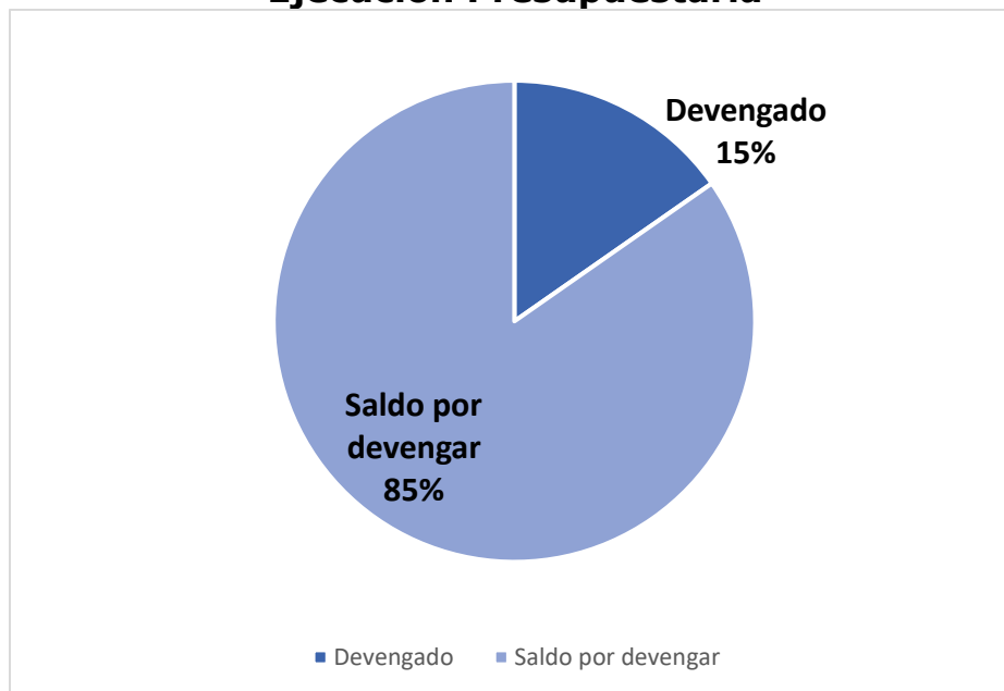
Gráfica No. 1 Viceministerio de Inversión y Competencia Ejecución Presupuestaria