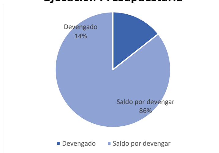
Gráfica No. 1 Viceministerio Administrativo y Financiero Ejecución Presupuestaria

Fuente: Sistema de Contabilidad Integrada (Sicoin) 07/04/2026