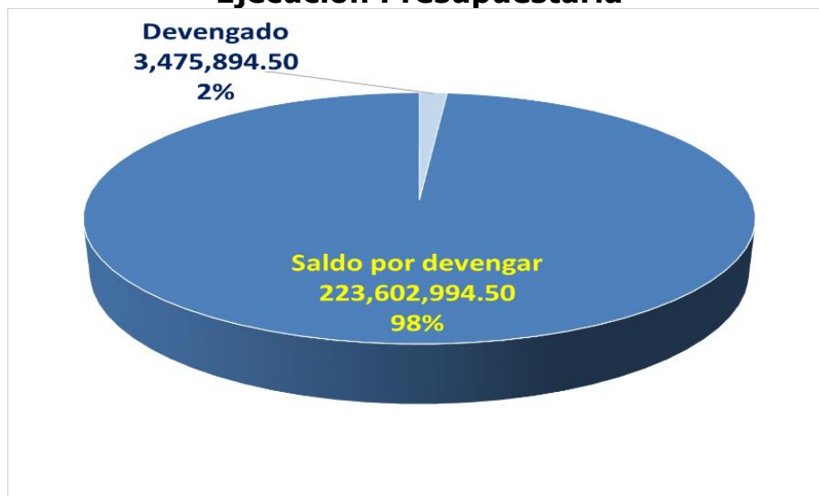
Gráfica No. 1 Viceministerio Administrativo y Financiero Ejecución Presupuestaria

Fuente: Sistema de Contabilidad Integrada (Sicoin) 04/02/2025 9:43