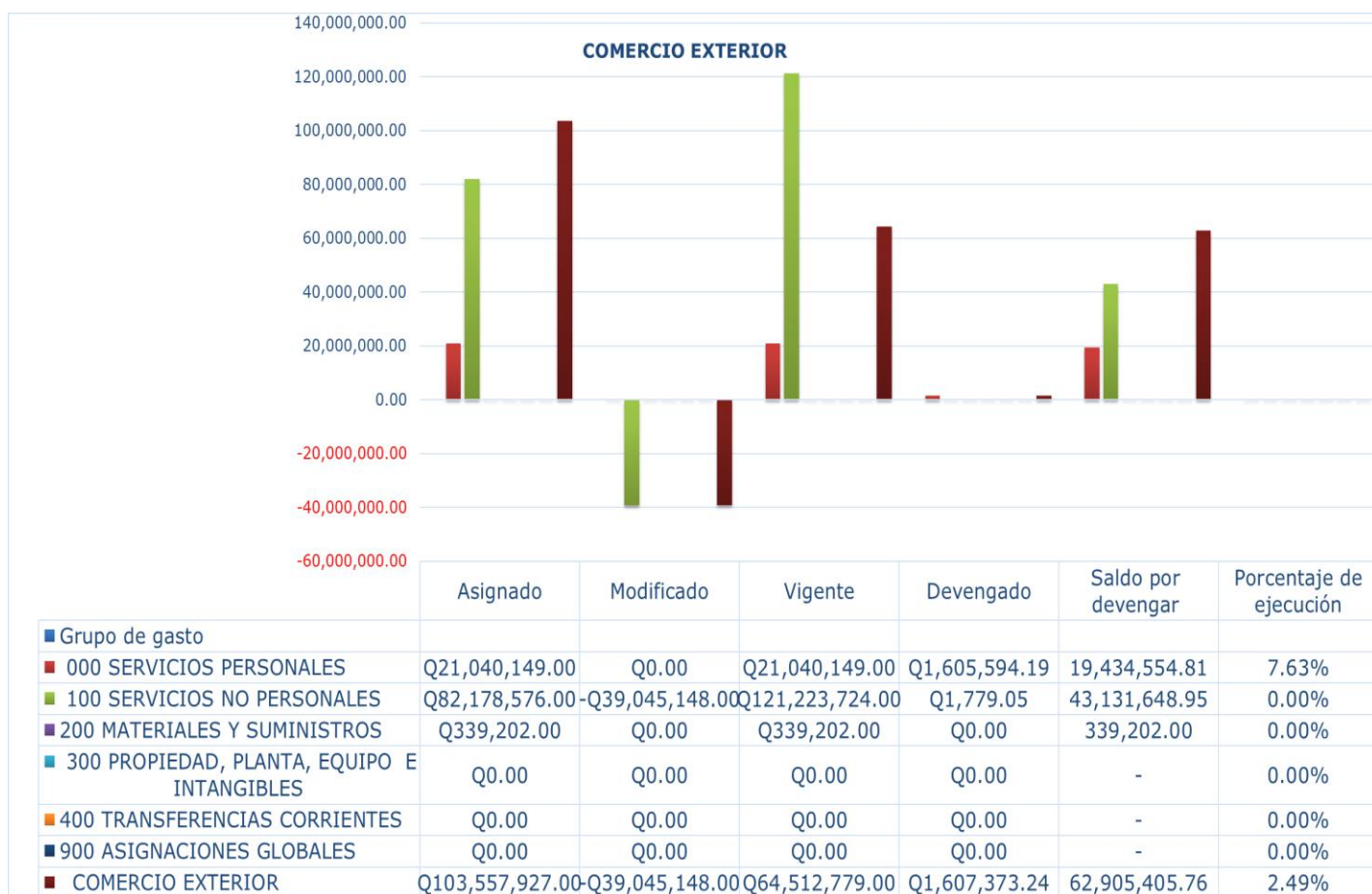
Gráfica No. 2 Viceministerio de Integración y Comercio Exterior División del presupuesto por grupo de gasto

Fuente: Sistema de Contabilidad Integrada (Sicoin) ) 04/02/2025 9:43