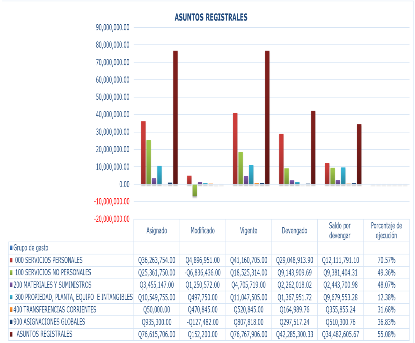
Gráfica No. 2 Viceministerio de Asuntos Registrales Ejecución Presupuestaria