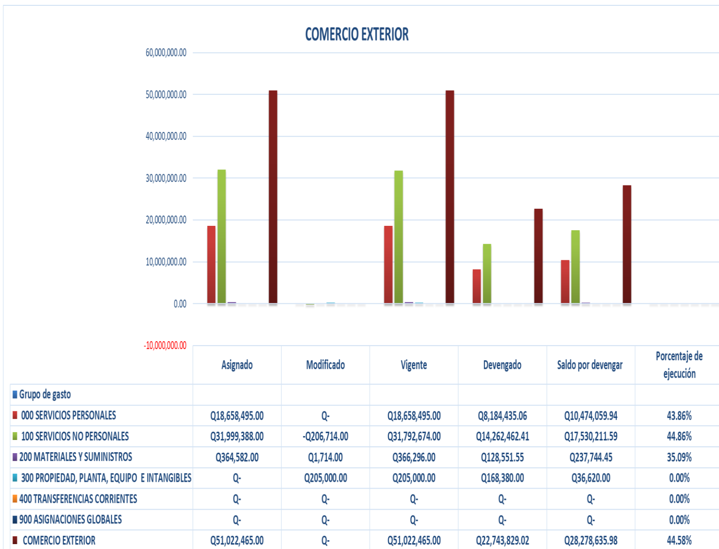
Gráfica No. 2 Viceministerio de Integración y Comercio Exterior Ejecución Presupuestaria Al mes de junio de 2024