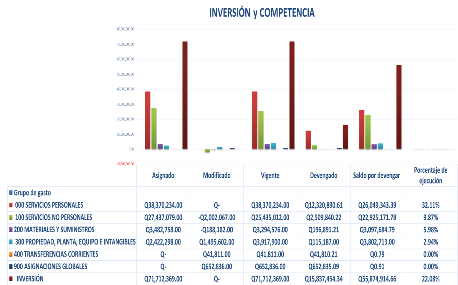
Gráfica No. 2 Viceministerio de Inversión y Competencia Ejecución Presupuestaria Al mes de abril de 2024