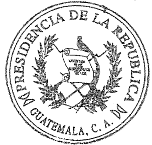
OTTO FERNANDO PÉREZ MOLINA